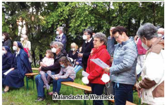
Maiandacht in Wiesfleck