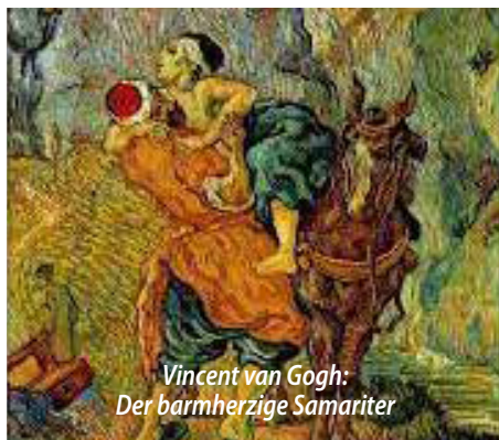
Vincent van Gogh: Der barmherzige Samariter

Papst Franziskus zitiert hierfür folgendes Beispiel aus der Bibel: „Jesus erzählt, wie ein verwundeter Mann am Wegesrand auf dem Boden lag, weil er überfallen worden war. Mehrere Menschen gingen an ihm vorbei und blieben nicht stehen. Es waren Menschen mit wichtigen Stellungen in der Gesellschaft, die aber die Liebe für das Gemeinwohl nicht im Herzen trugen. Sie waren nicht in der Lage, einige Minuten zu erübrigen, um dem Verletzten zu helfen oder zumindest Hilfe zu suchen. Einer blieb stehen, schenkte ihm seine Nähe, pflegte ihn mit eigenen Händen, zahlte aus eigener Tasche und kümmerte sich um ihn. Vor allem hat er ihm etwas gegeben, mit dem wir in diesen hektischen Zeiten sehr knausern: Er hat ihm seine Zeit geschenkt. Sicherlich hatte er sein Programm für jenen Tag, entsprechend seiner Bedürfnisse, seiner Aufgaben oder seiner Wünsche. Aber er ist fähig gewesen, angesichts dieses Verletzten alles beiseite zu legen, und ohne ihn zu kennen, hat er ihn für würdig befunden, ihm seine Zeit zu schenken.“